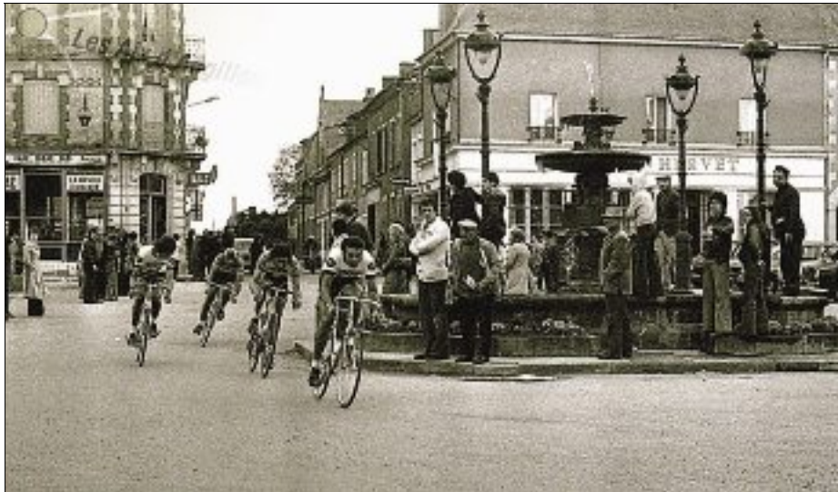
ACCÉLÉRATION. Le démarrage décisif survient souvent dans la traversée d'Henrichemont (ici la place Henri-IV), qui marque le seuil entre les reliefs du Sancerrois et le long toboggan vers l'arrivée à Bourges.